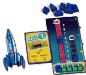
Lift Off 23